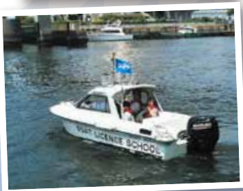
マリンウィーク開催実績表