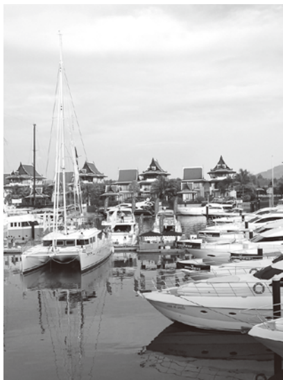
撮影地 プークェット (タイ国)